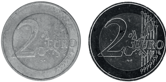
links: diffuses Auflicht