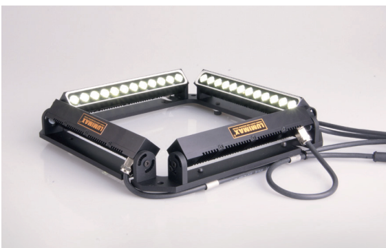
LUMIMAX® Balkenbeleuchtungen der LSB-Serie im Montagerahmen

Welche Variante benutzt wird, ist zum einen abhängig vom Prüfobjekt selbst, aber auch von den Einbaubedingungen vor Ort. Da die Dunkelfeldbeleuchtung aufgrund des flach einstrahlenden Lichts mit einem sehr kleinen Arbeitsabstand arbeitet, ist es nicht immer möglich, eine geschlossene Ringbeleuchtung zu verwenden. In diesen Fällen wird häufig auf eine Kombination von Balkenbeleuchtungen zurückgegriffen.