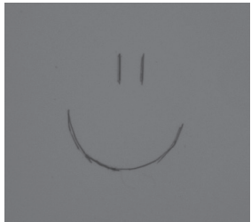
Kratzer auf Plexiglas - diffuses Durchlicht