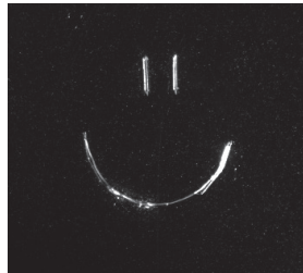
Kratzer auf Plexiglas - Dunkelfeld-Durchlicht